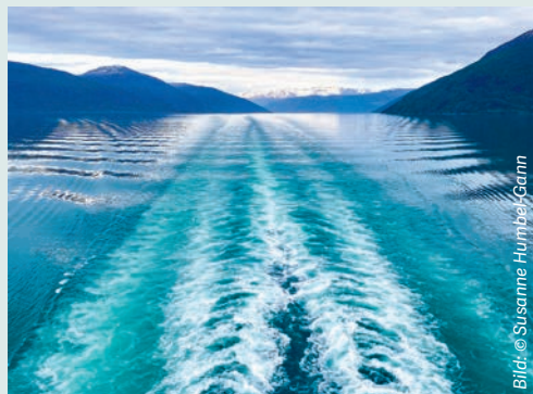
Eine Spur auf dem Wasser im Sognefjord, Norwegen.