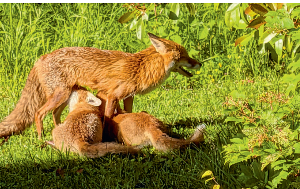
Die Füchse sollen mit Lärm oder Wasser vertrieben werden.

Das Merkblatt «Füchse im Quartier» ist auf der Website des kantonalen Amtes für Natur, Jagd und Fischerei zu finden: www.sg.ch/umwelt-natur/jagd-fischerei .