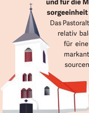
Kirche: wegen Umbau geöffnet.