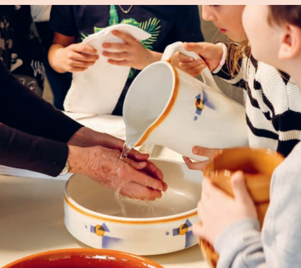
Händewaschung am Eingang.