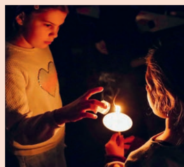
Alle können eine Kerze anzünden.