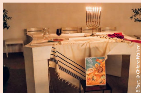
Olivenbäume, siebenarmiger Leuchter, überlaufender Weinkelch, jüdischer Gebetsschal, Ikone «Jesus im Ölgarten» und viele Kerzen, die von den Leuten angezündet wurden.