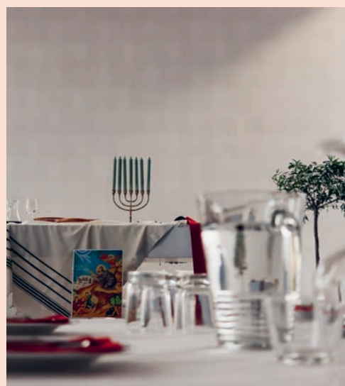
Alles ist hergerichtet!