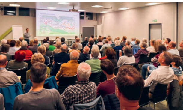
Die Themen führten am Informationsanlass zu engagierten und kontroversen Diskussionen.

Vergangene Woche informierte die Gemeinde die Anwohnenden des Bruggwaldquartiers über die geplante Einführung von Tempo 30 sowie über die Installation von acht Halbunterflurbehältern (HUFB) für die Abfallentsorgung. Rund 90 Personen der etwa 450 angeschriebenen Haushalte folgten der Einladung. Der Anlass behandelte zwei Teilprojekte im Quartier: – den Bereich Bruggwaldpark / Waldsteig – die 1. Etappe der Bruggwaldstrasse mit Ziegeleistrasse, Weiherweg und Brugghalde