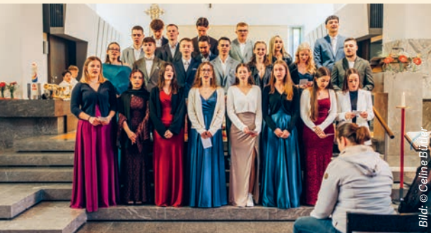
Der Chor der Firmgruppe. Er singt den Song «Chöre» von Mark Forster.