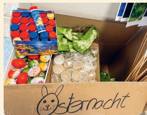
Vieles ist schon bereit!