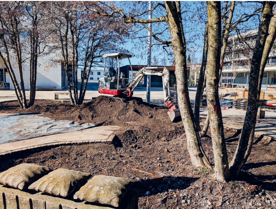
Letzte Woche haben die Arbeiten für die zweite Etappe der Aufwertung des Zentrumsplatzes begonnen.

Publikationsorgan der Gemeinde Wittenbach Erscheint donnerstags in Wittenbach.