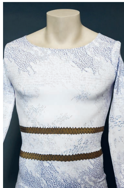
Ein T-Shirt-Prototyp, der dank der integrierten textilen Sensoren Vitaldaten erfassen kann.

«Eine gute technische Idee allein reicht noch nicht aus, damit aus einem Prototyp ein Produkt wird.»