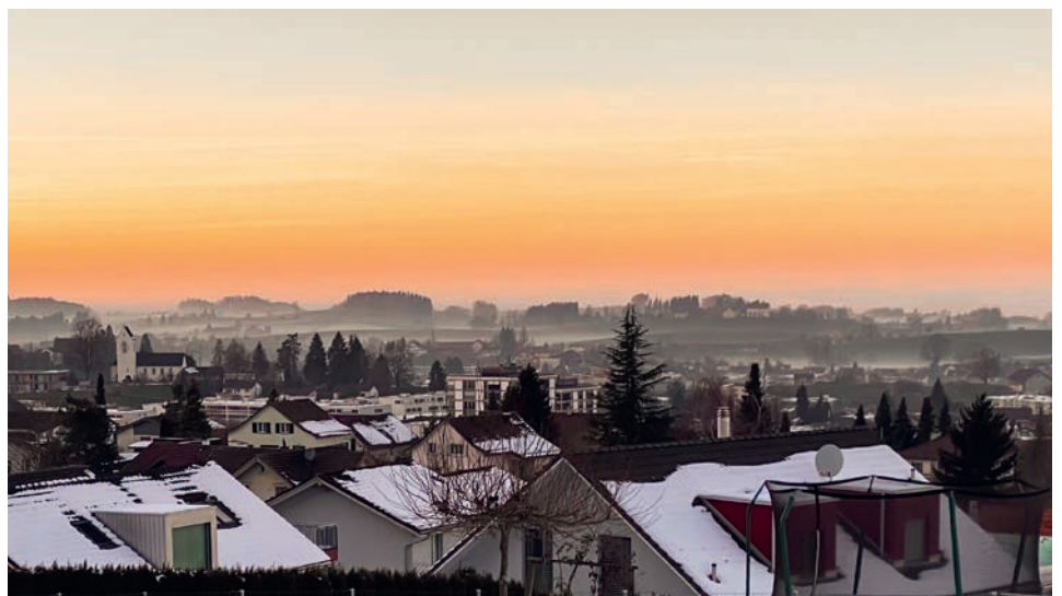
Ortsplanung, Gewässerraumfestlegung oder Parkplatzbewirtschaftung sind nur drei von verschiedenen Themen und Aufgaben, welche in diesem Jahr in der Gemeinde Wittenbach anstehen.

Das Pilotprojekt wird abgeschlossen und eine Überführung in den Regelbetrieb wird geprüft.