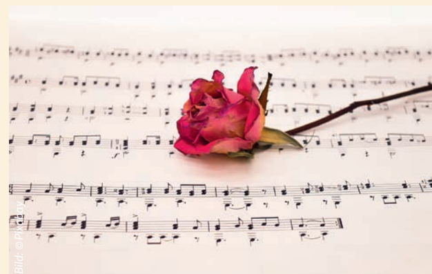
Noteblatt mit Rose