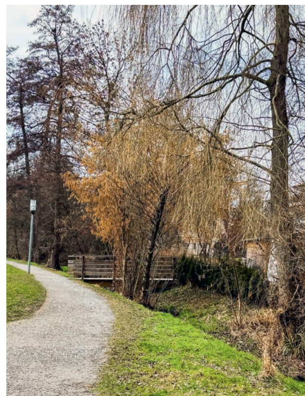
Archivbild, 25. Februar 2025