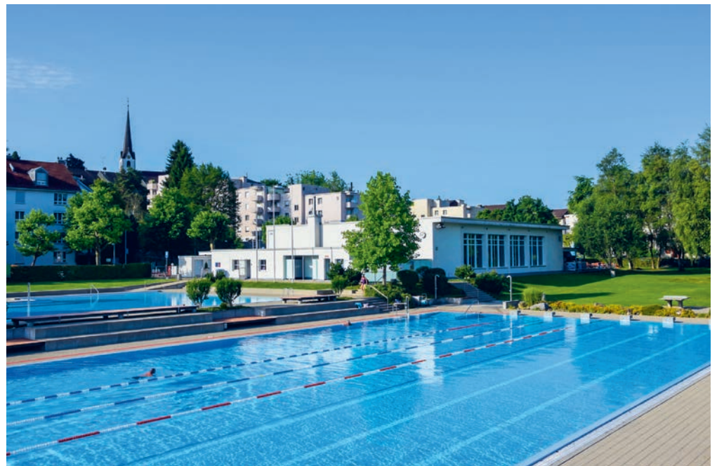
Die Mitarbeitenden haben die Anlage auf Vordermann gebracht, damit sie nun bereit für die Badigäste ist.

Publikationsorgan der Gemeinde Wittenbach Erscheint donnerstags in Wittenbach.