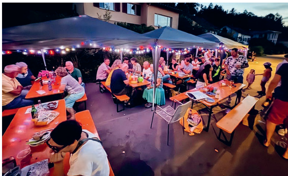
Im vergangenen Jahr fanden im Rahmen des «Tag der Nachbarschaft» verschiedene Aktivitäten statt, wie z. B. ein Quartierfest.

Montag bis Donnerstag, 14.00 bis 17.00 Uhr