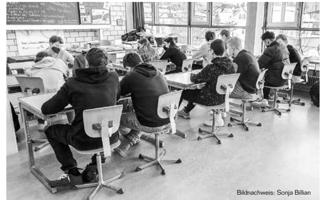
Bildnachweis: Sonja Billian

Das Unterwegssein mit den jungen Menschen geschieht auch im Unterricht, dort natürlich auf andere Weise, ist aber auch sehr wichtig und wertvoll. Junge Menschen mit Kompetenzen auszustatten, z. B. sie zu befähigen, Empathie zu entwickeln, indem sie sich in Lebenssituationen hineinversetzen, die ihnen fremd sind, das kann nur gut sein und einer Gesellschaft hohen Nutzen bringen. Sie zu sensibilisieren für viele Themen, über die sie sonst eher nicht nachdenken würden, das ist eine grosse Stärke und Chance dieses Fachs. Sich auch mal an die Grenzen zu wagen, wenn es um Themen geht wie Krankheit, Sterben, Tod, Sterbehilfe ja oder nein, Behinderung und Lebenssinn, Fluchterfahrungen, um nur einige zu nennen.